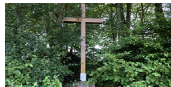
Wegkreuz Radweg Richtung Künten

Ein Flurkreuz (auch Wegkreuz) ist ein Kreuz an einer Wegkreuzung, einem Weg oder einer Straße, am Feldrand oder im Wald. Es kann aus Holz, Stein oder Metall bestehen. Häufig sind Flurkreuze als Kruzifixe, das heißt mit Darstellung des gekreuzigten Christus, gestaltet. Sie sind Zeichen christ-