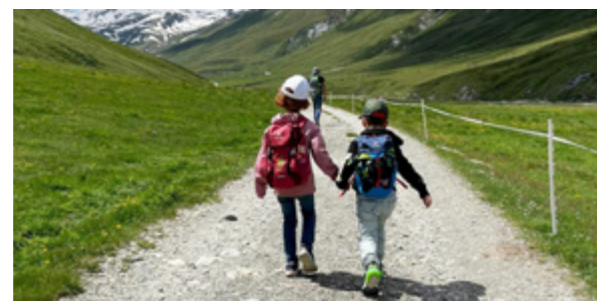
»Kinder auf dem Weg des Glaubens«

Nachdem die Eltern der 1. Klässler am Montag, 16. August verschiedene Infos erhalten haben zum katholischen Religionsunterricht in Künten, findet am Sonntag, 22. August bereits der erste Schüler-Gottesdienst statt. Die Handsalbung ist ein sinnvolles und wertvolles Zeichen für die Kinder, die nun bald Glaubenschüler-